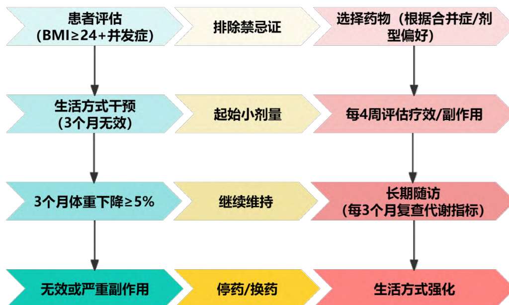
图 1 减重药物临床应用流程